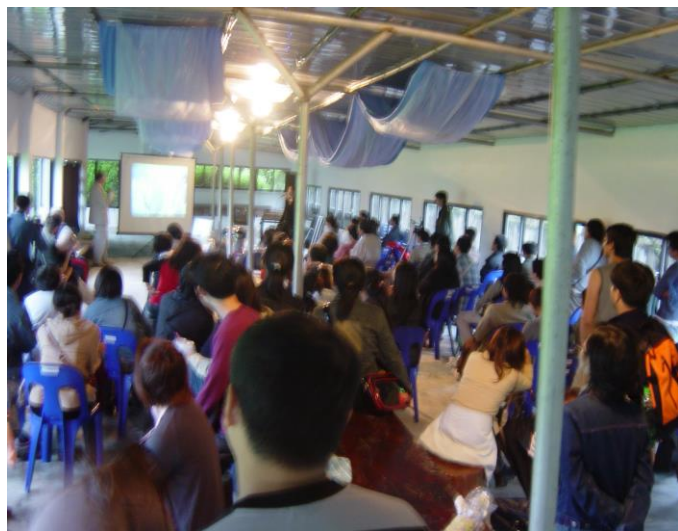
(圖十六) 俱樂部現場盛況