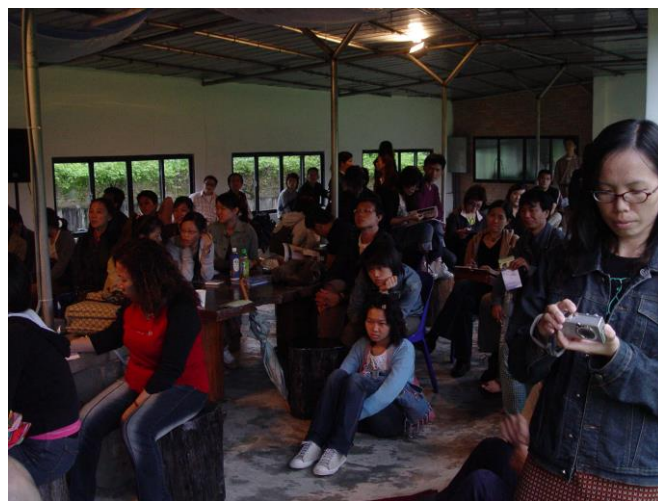
(圖十七) 藝術相關科系的學生爭相前來，實踐美術館學校的理想功能。