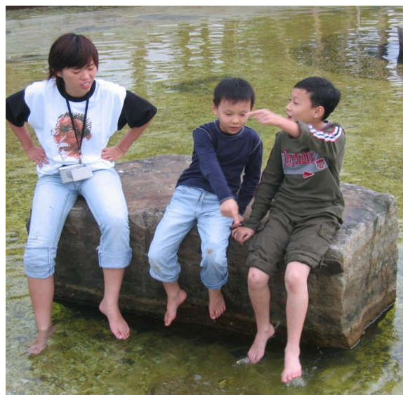
(圖十九) 以遊戲的互動方式讓小朋友產生相當大的興趣。