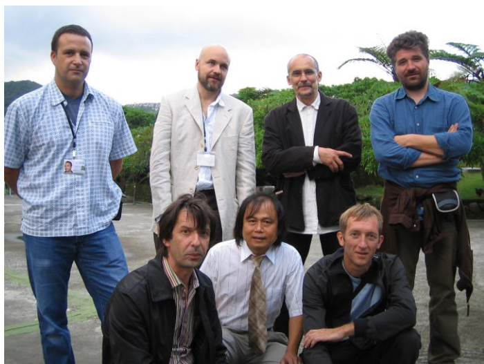
(圖二十) 藝術家合影