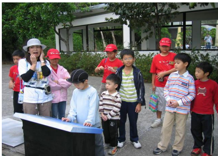
(圖十八) 教育推廣導覽員引導小朋友從作品反思環境